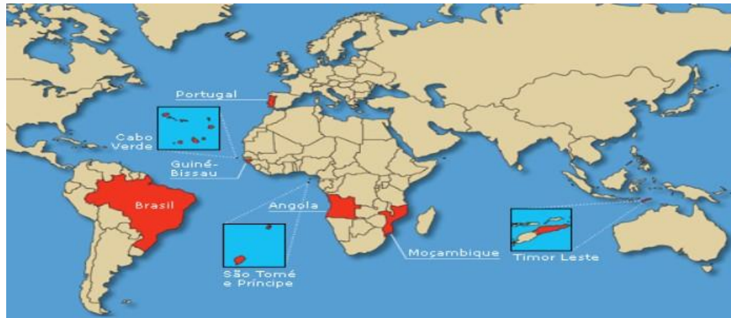
Portugal, Cabo Verde, Guiné-Bissau, S. Tomé e Príncipe, Angola, Brasil, Moçambique, Timor-Leste

Em 1996, foi constituída a Comunidade dos Países de Língua Portuguesa (CPLP) , que veio reforçar a cooperação entre esses países, assumindo Portugal um papel de interlocutor, sobretudo nas relações com a União Europeia.