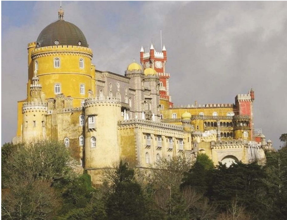
Figura 4 – Palácio da Pena, c. 1838-1868/1885