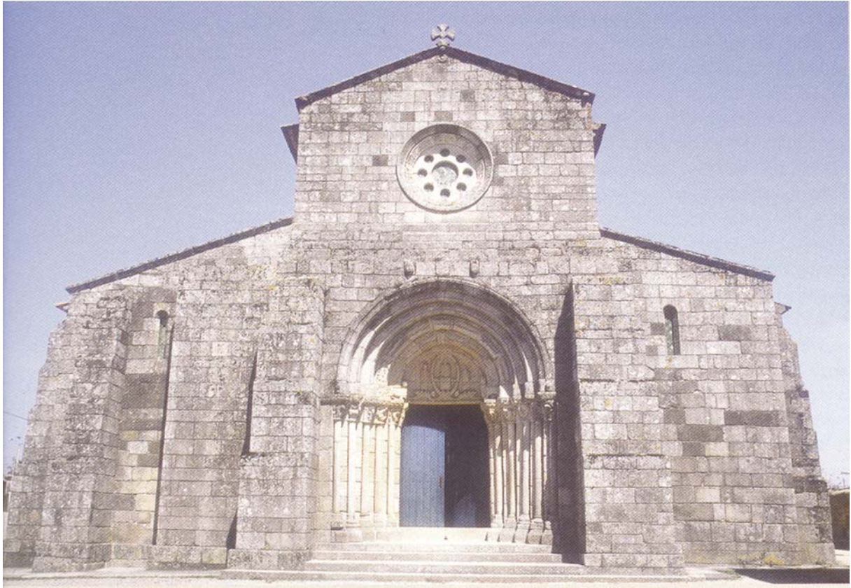
Figura 1 – Igreja de S. Pedro de Rates, c. 1100, in Ana Lúcia Pinto et al., Arte Portuguesa , Porto, Porto Editora, 2006