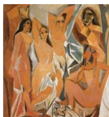
Pablo Picasso, As Meninas de Avinhão , 1907, óleo sobre tela, in A. Gantefürher-Trier, Cubismo , Taschen Público, 2005