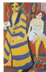
Ernst Kirchner, O Pintor e o Seu Modelo , 1907, óleo sobre tela, in E. Bernard, A Arte Moderna 1905-45 , Lisboa, Edições 70, 2000