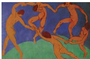
Henri Matisse, A Dança , 1909/1910, óleo sobre tela, in Karl Ruhrberg et al., Arte do Século XX , vol. I, Taschen, 2005