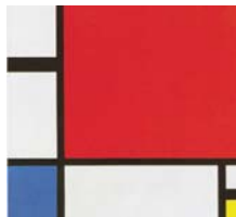
Piet Mondrian, Composição com Vermelho, Amarelo e Azul , 1930, óleo sobre tela, in Sandro Sproccati (dir.), Guia de História da Arte , Lisboa, Editorial Presença, 2002