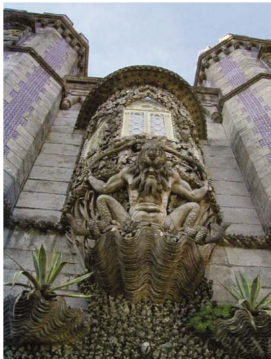
Figura 5 – Pórtico do Tritão