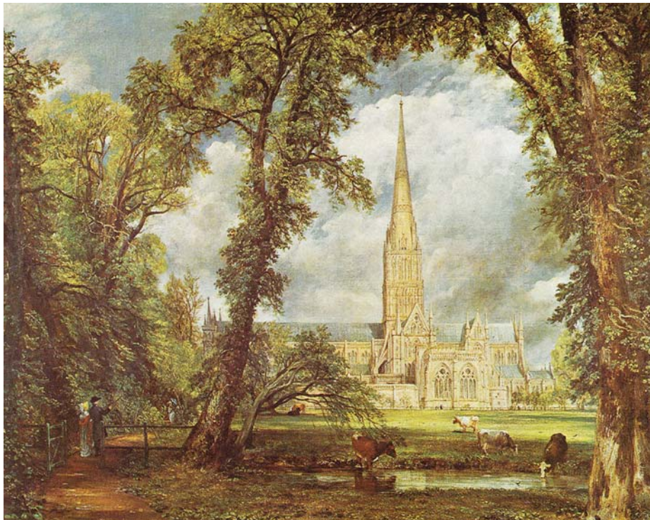
Figura 3 – John Constable, Catedral de Salisbúria vista da Propriedade do Bispo , 1828, óleo sobre tela, in Norbert Wolf, A Pintura da Era Romântica , Taschen, 1999

2. Caracterize, com base na Figura 3, a relação do artista com a natureza, na pintura romântica.