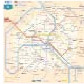
Plan de Paris