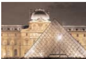
La pyramide du Louvre