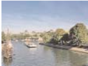
Bateau-mouche sur la Seine