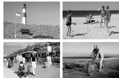
auf der Insel Sylt an der Nordsee

Sonne, Strand und Meer sind bei Jugendlichen beliebt: Bei Meer genießen auf Sylt wohnen die 15- bis 19-Jährigen in einem gemütlichen Haus. Von dort aus starten Ausflüge zu den Walen. Die Freizeit findet vom 14. bis 26. August statt und kostet 340 Euro.