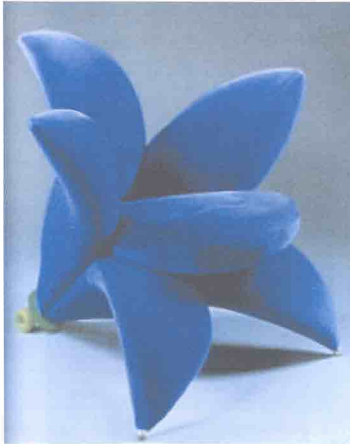
Figura 3. – Masanori Umeda, cadeira Getsuen, para a Edra, 1990