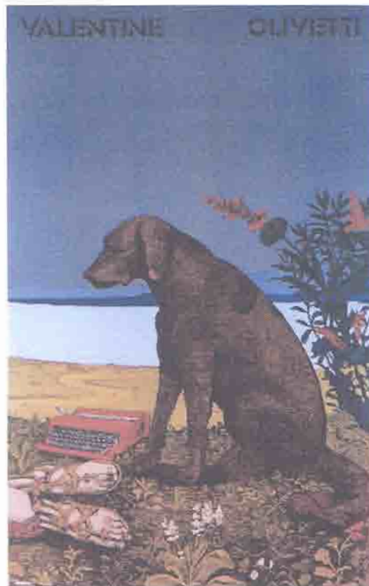
Figura 1 – Milton Glaser, cartaz alusivo à máquina de escrever Valentine, para a Olivetti, 1970