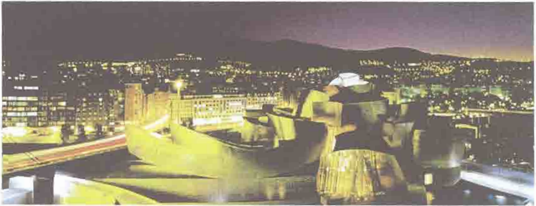
Figura 2 – Frank Gehry, vista nocturna do Museu Guggenheim , em Bilbao