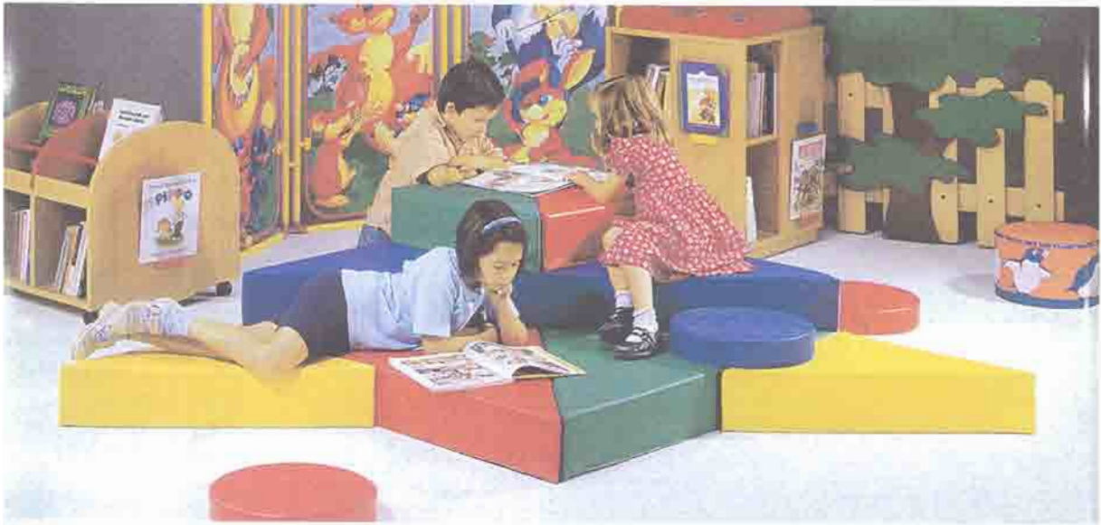
Figura 4 – Espaço com equipamento para crianças