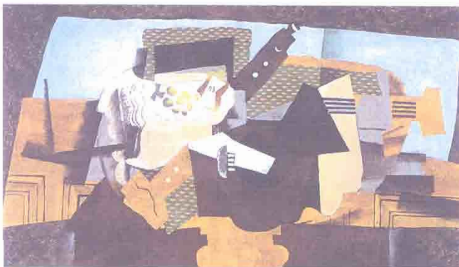
Figura 4 – Georges Braque, A Mesa Negra (1919)