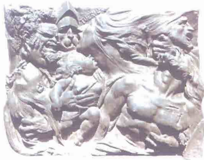
Figura 1 – Auguste Pr eault, O Massacre (bronze de 1850, segundo gesso de 1834)