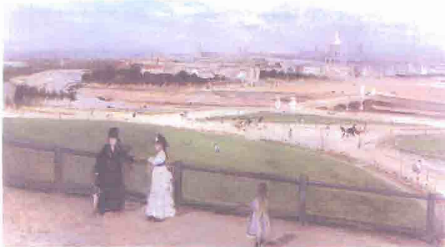
Figura 2 – Berthe Morisot, Vista de Paris, Tirada do Trocadero (1872)

Destaque a import ncia da escultura rom ntica em Fran a.