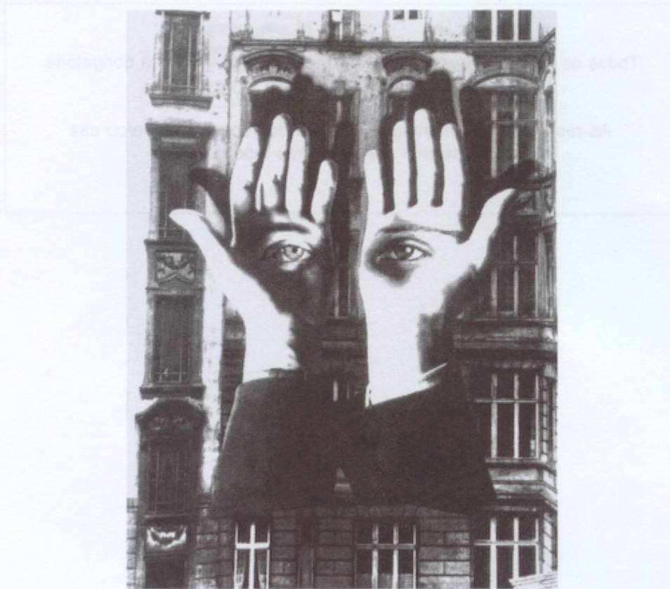
Figura 2 – Herbert Bayer, O Cidadino Solitário , fotomontagem, 1932