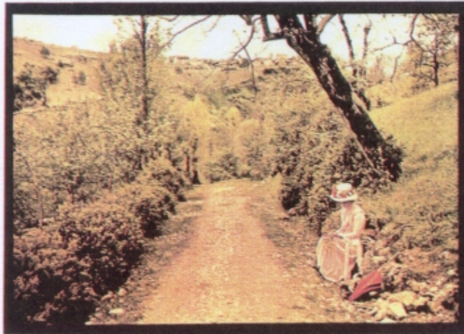
Figura 1 – Louis Lumière, Rapariga de Sombrinha , autocromo, 1907-10