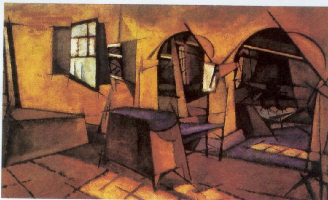
Figura 3 – Amadeo Souza-Cardoso, Cozinha de Manhufe , 1913

«Eu não sigo escola alguma. As escolas morreram. Nós, os novos, só procuramos agora a originalidade. Sou impressionista, cubista, futurista, abstraccionista? De tudo um pouco.»