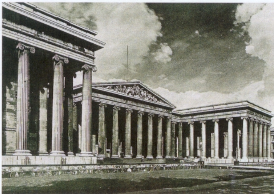
Figura 1 – Robert Smirke, Museu Britânico , Londres, 1823-47