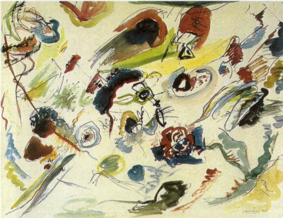
Figura 2 – W. Kandinsky, Primeira Aguarela Abstracta , 1910