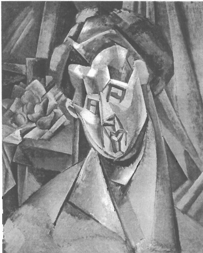
Fig. 1 — P. Picasso, Mulher com pêras , 1909